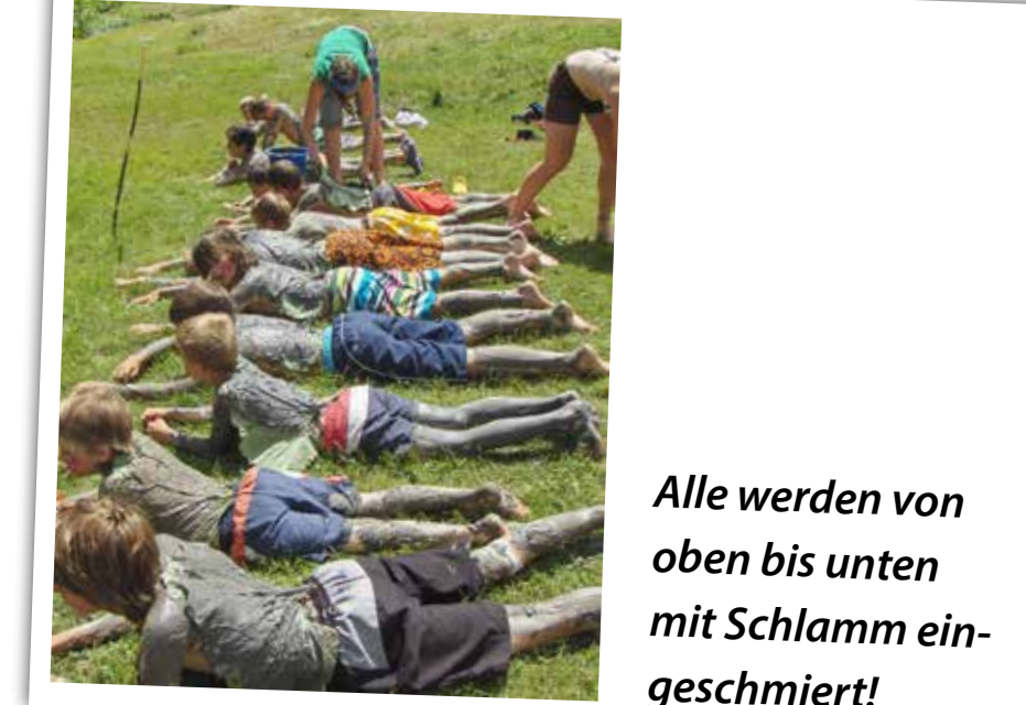
Alle werden von oben bis unten mit Schlamm eingeschmiert!