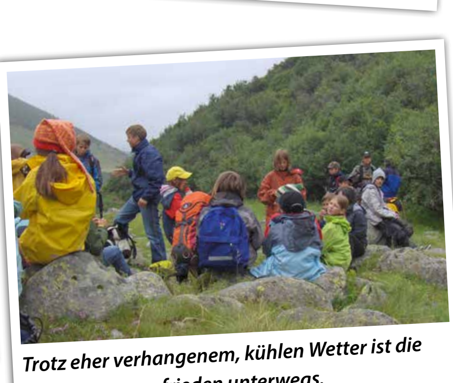
Trotz eher verhangenem, kühlen Wetter ist die Lagergruppe zufrieden unterwegs.