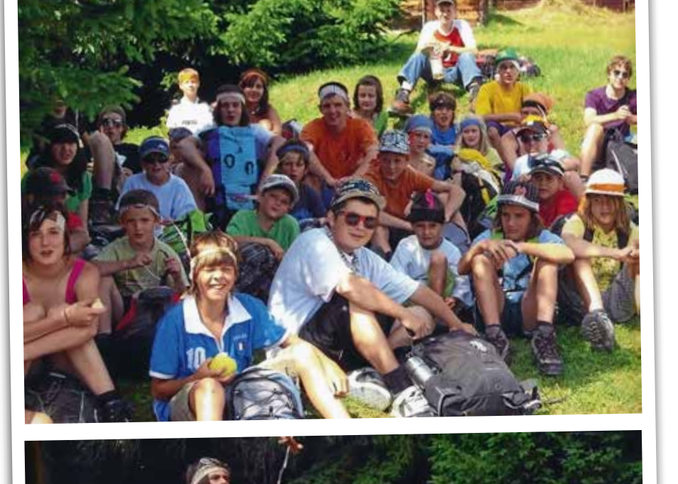
Bei herrlichem Sommerwetter legt die Jugendgruppe auf der Wanderung eine Mittagspause ein. Alle geniessen die selbst gebrätelte Servelat.