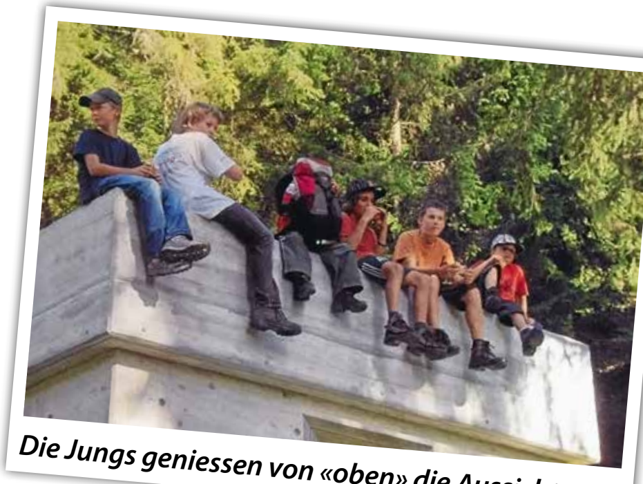
Die Jungs geniessen von «oben» die Aussicht.