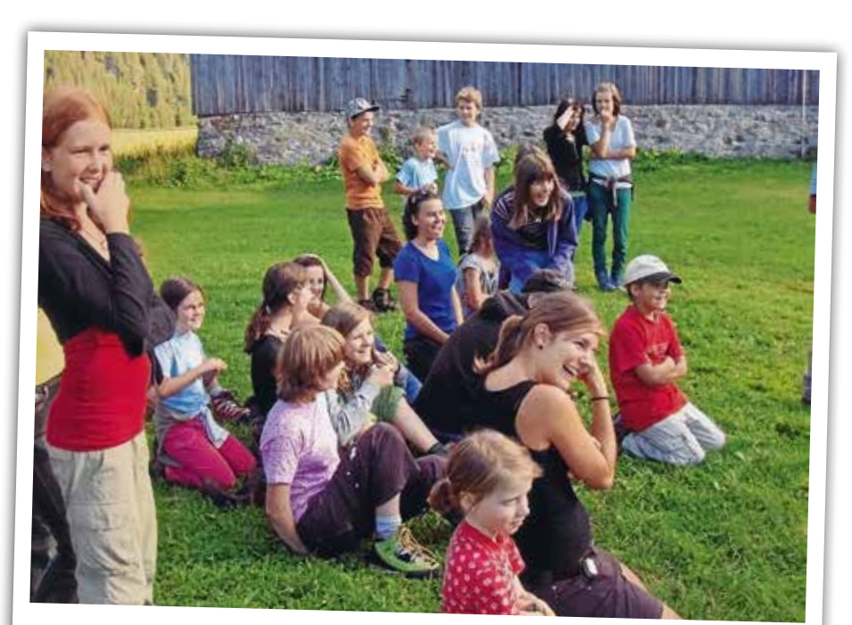
Ein Sommerlager mit viel Spass.