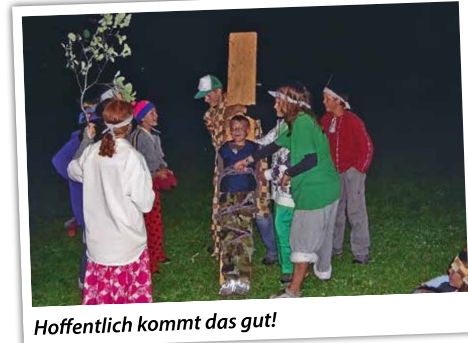
Hoffentlich kommt das gut!