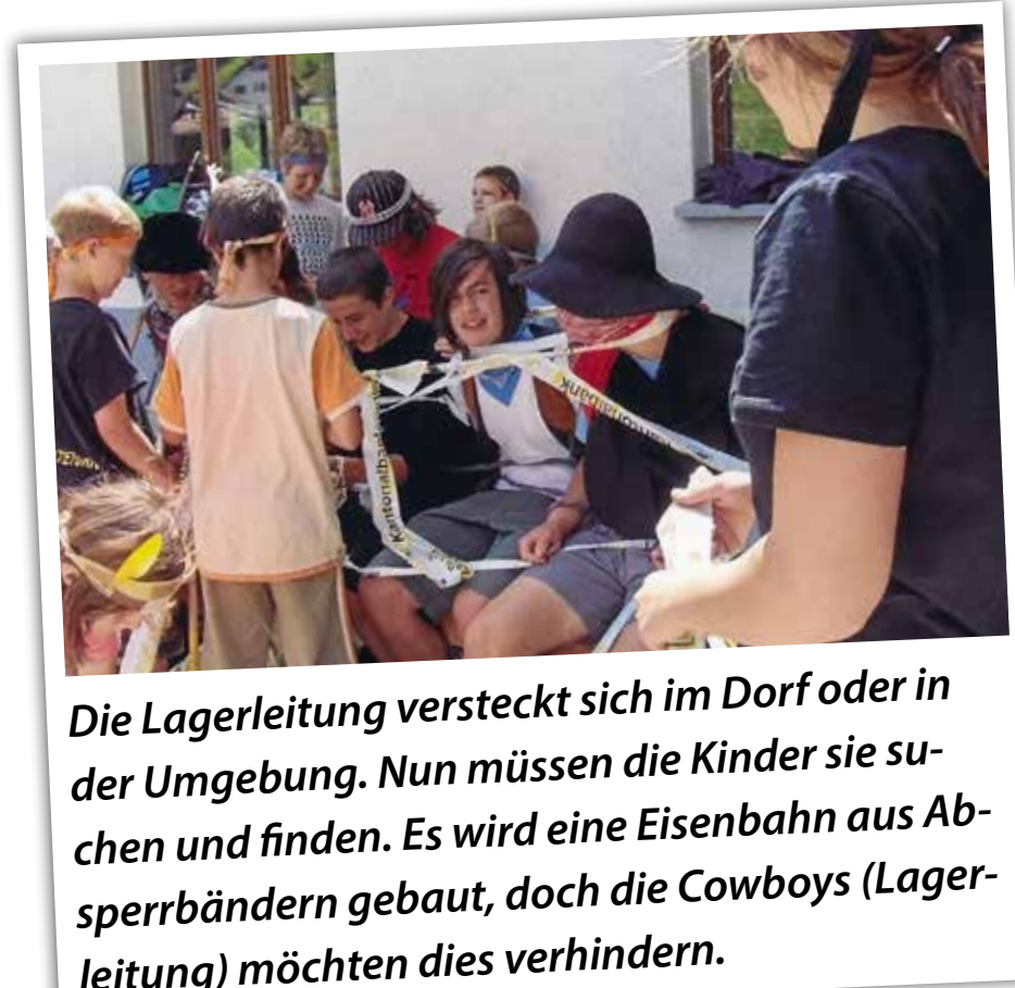
Die Lagerleitung versteckt sich im Dorf oder in der Umgebung. Nun müssen die Kinder sie suchen und finden. Es wird eine Eisenbahn aus Ab-sperrbändern gebaut, doch die Cowboys (Lagerleitung) möchten dies verhindern.