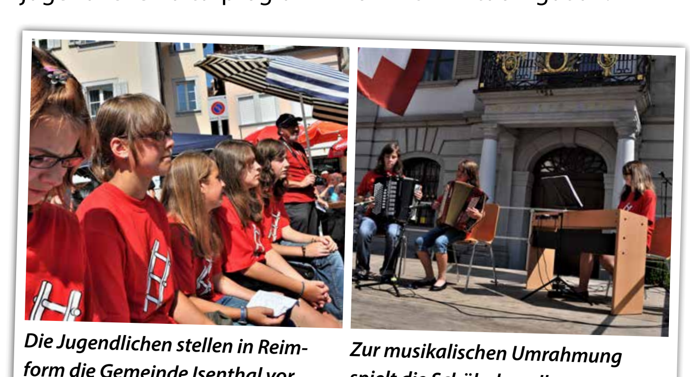
Die Jugendlichen stellen in Reimform die Gemeinde Isenthal vor. Zur musikalischen Umrahmung spielt die Schülerkapelle.

Isenthal ist Gastgemeinde an der 1. Augustfeier in Altdorf. Das jugendliche Kulturprogramm kommt in Altdorf gut an.